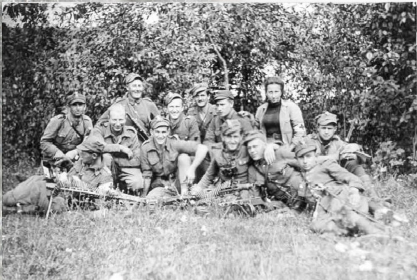
Żołnierze 4. szwadronu 5. Wileńskiej Brygady AK.