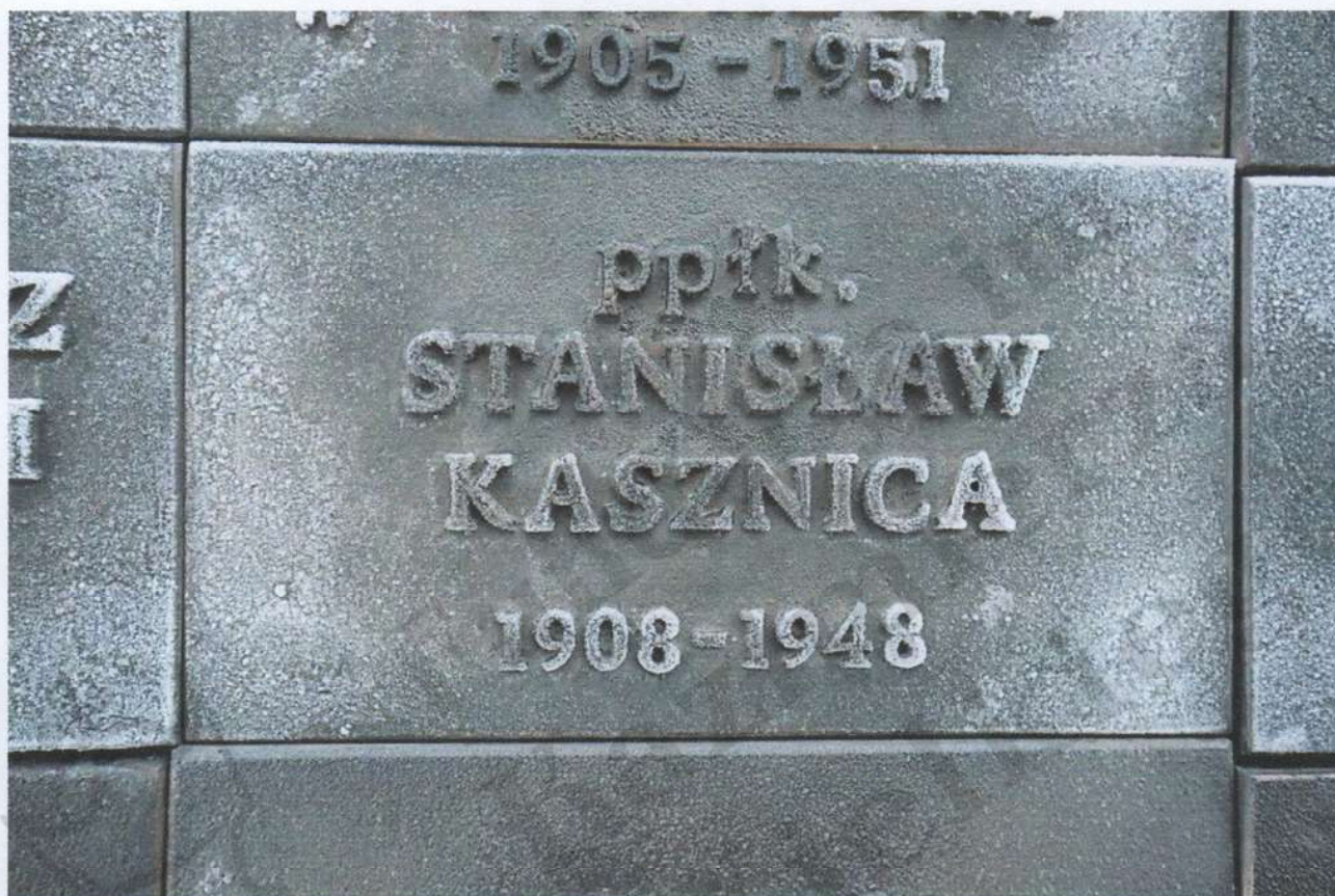
Tablica pamiątkowa wspominająca Kasznicę na monumencie wybudowanym i odsłoniętym w 1990 roku.