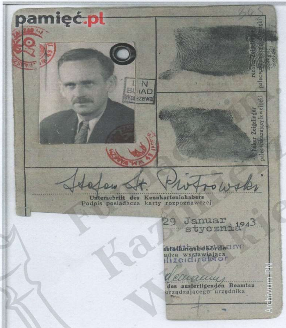
Kenkarta Kasznicy z czasów okupacji niemieckiej (warto spojrzeć na jego podpis)